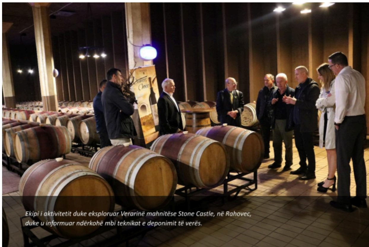
Ekipi i aktivitetit duke eksploruar Verarinë mahnitëse Stone Castle, në Rahovec, duke u informuar ndërkohë mbi teknikat e deponimit të verës.

Një prej vizitave interesante të ekipit, pas ceremonisë hapëse, ishte në Qendrën për Inovacion