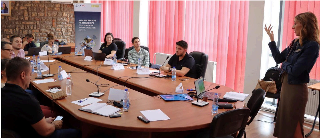
Figura 3: Sesion trajnimi i Analitikës Arsimore në Fakultetin e Shkencave të Jetës dhe Mjedisit, Universiteti i Prizrenit