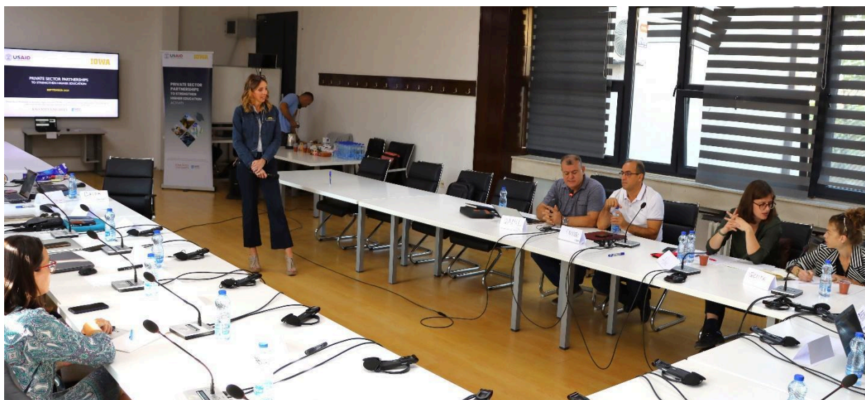
Figura 1: Sesion trajnimi i Analitikës Arsimore në Fakultetin e Inxhinierisë Elektrike dhe Kompjuterike, Universiteti i Prishtinës

https://drive.google.com/drive/folders/15Dcr3ugzb3SCEppOKO7MPNT2zUOVHmmX